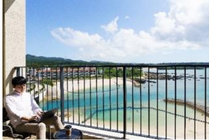
▲客室のオープンエアバルコニー