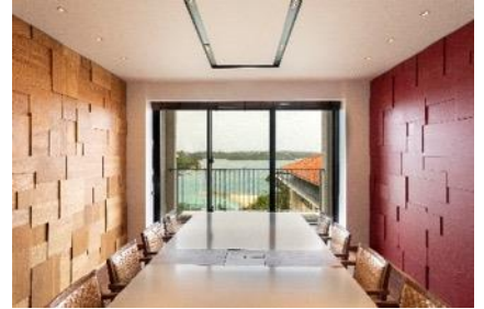
▲ミーティングルーム