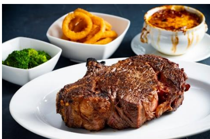
▲オールデイダイニング セラーレ